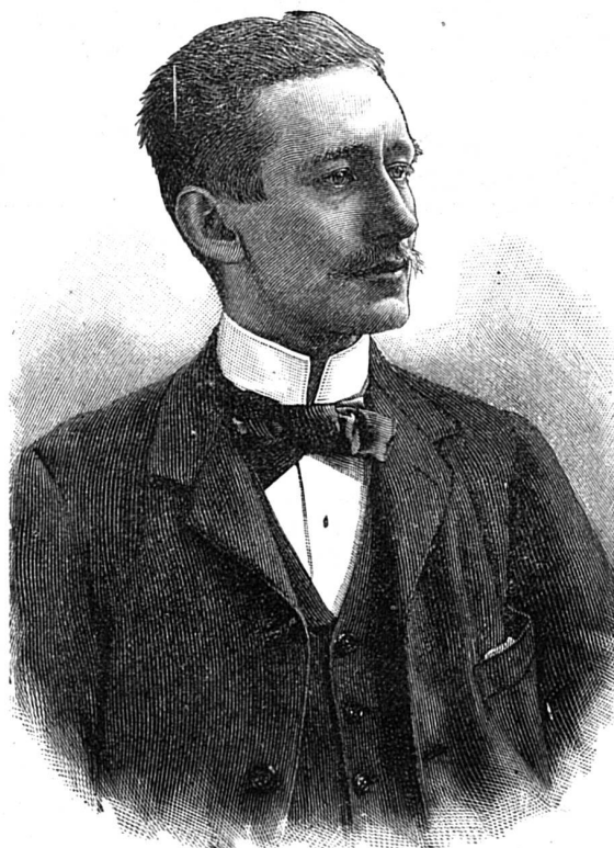
Guillaume Marconi, inventeur de la télégraphie sans fil

Dans la Bresse et la Sarthe, on donne des pâtons constitués par un mélange de farine d'orge, de sarrasin et d'avoine délayée dans du lait doux ou tourné.