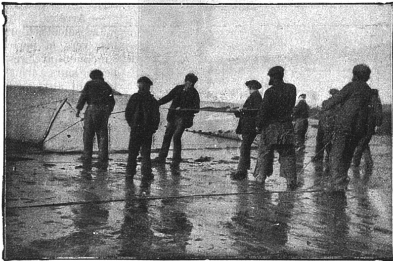
L'emplacement des filets

Notre image nous fait voir un patron de barque de sauvetage. Qui sait combien de vies il a sauvées dans sa