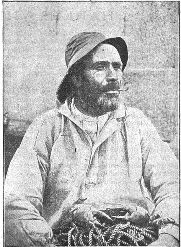
Patron de bateau de sauvetage

La Bretagne est aussi connue par le dévouement dont font preuve si fréquemment les marins qui vont au péril de leur vie secourir les navires en détresse échouant sur les côtes par les jours de tempête. Il est parmi ces humbles pêcheurs des héros dont les noms seraient bien dignes de passer à la postérité.