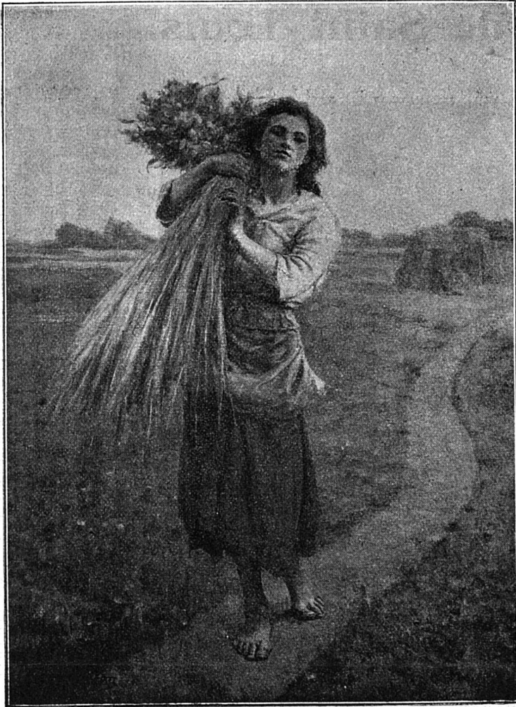
Glaneuse, par Jules Breton.

De tous les types qu'il a créés, M. J. B. garde une préférence pour cette figure de glaneuse qui vient à nous, droite, campée comme une statue, soutenant une gerbe sur son épaule.