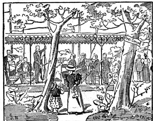
Où est le chef d'orchestre?

— Parbleu! un volontaire de quatre-vingt douze!