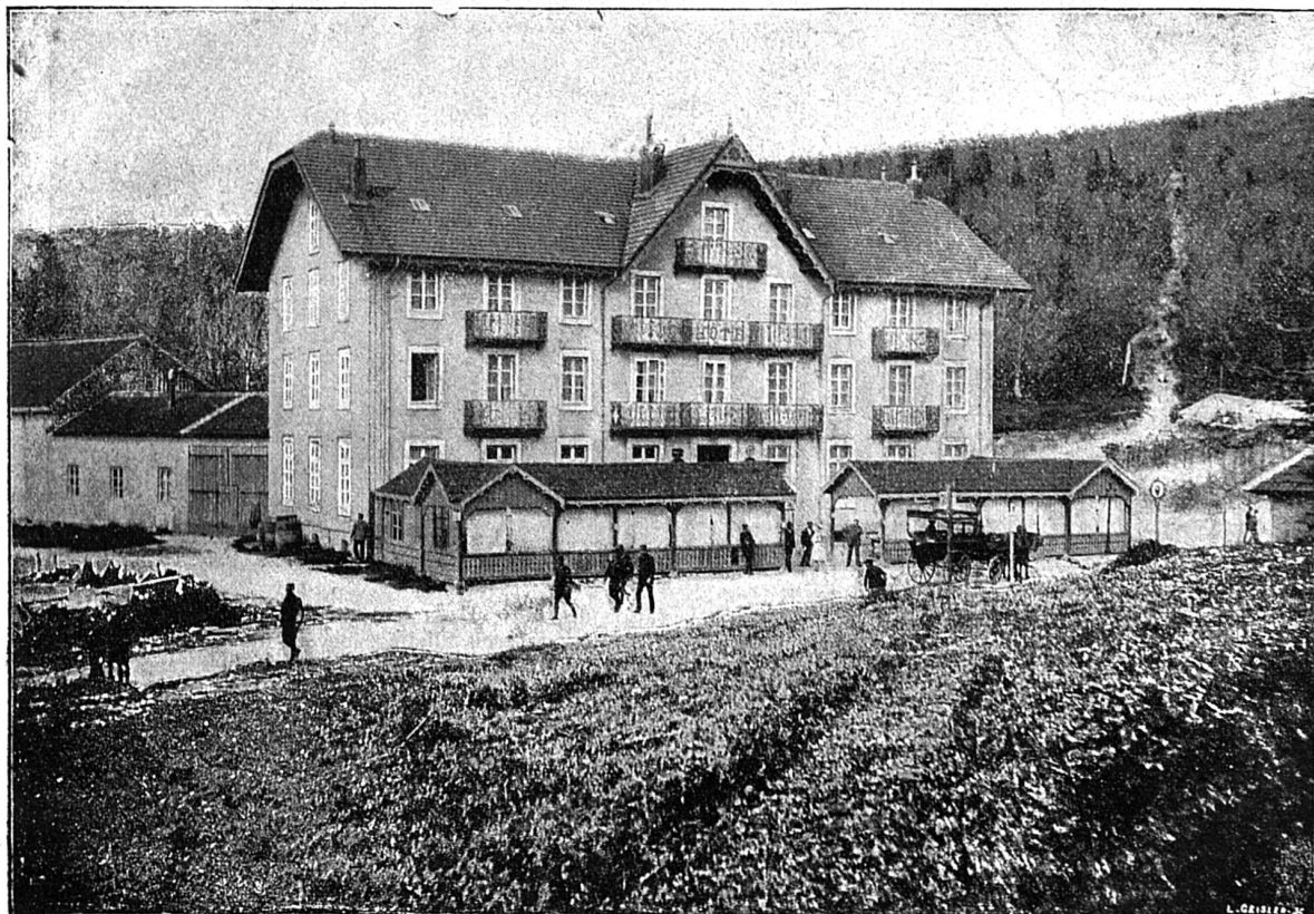
Hôtel de la Schlucht (près de la frontière)

Et, par fond de val, coule la Plaine, un joli ruisseau,