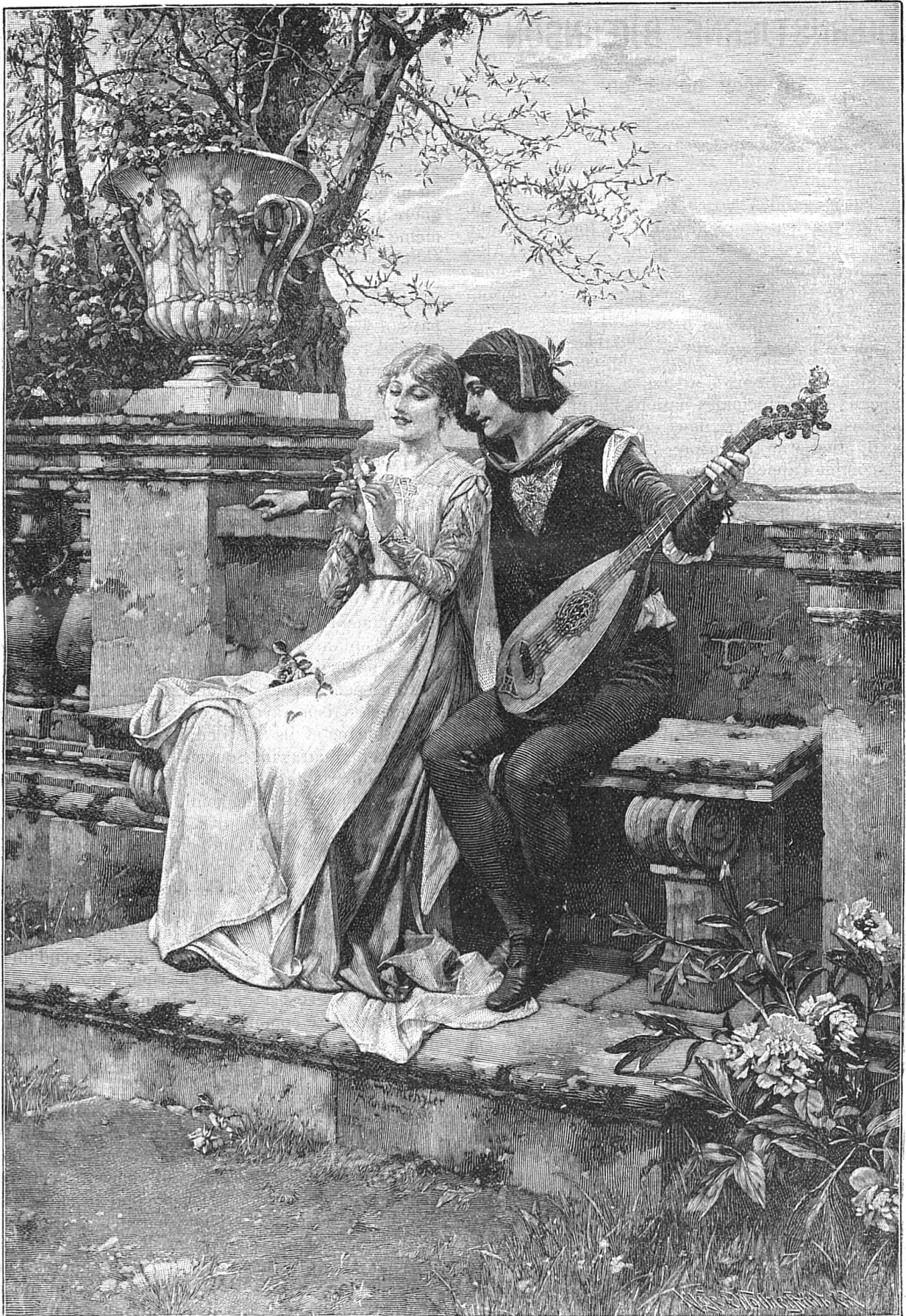
Au temps des fleurs (d'après le tableau de W. Menzler.)