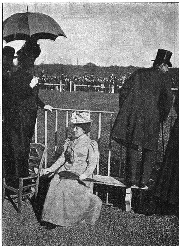
Près de la piste (Longchamps)

Or la course, qui comporte une distance de 3000 mètres, dure trois minutes et une vingtaine de secondes. Gagner 280,000 francs en si peu de temps ! dira-t-on. La réflexion est juste. Mais il convient de dire que, pour arriver à cette victoire, le propriétaire du cheval vainqueur a dépensé de grosses sommes ; qu'il a élevé chaque année 60, 80, 100 poulains et pouliches avant d'avoir trouvé un sujet capable de figurer dans le grand prix de Paris ; que, pendant dix ans peut-être, il n'a pu arriver à décrocher la riche timbale, et que souvent il n'arrive jamais à la décrocher.