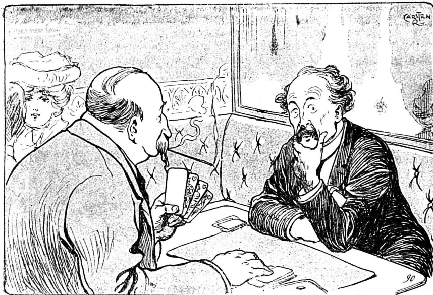
LE JOUEUR DE PIQUET. — Ma quatrième est majeure. L'AGENT MATRIMONIAL ( distrail ). — Il serait temps de la marier ; quelle dot lui donnez-vous ?