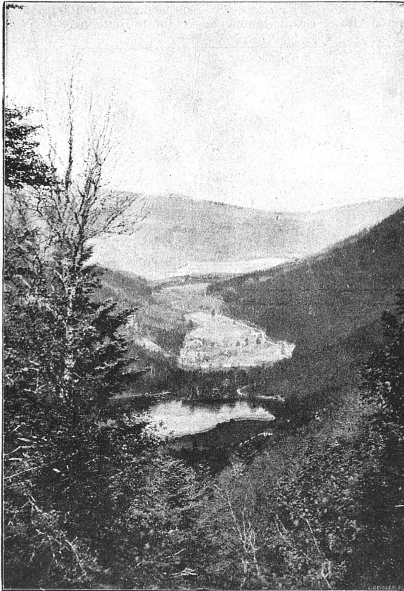
La Vallée des Lacs

Et toujours, en avançant, c'est une succession de