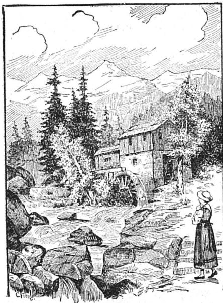
Où est le meunier ?