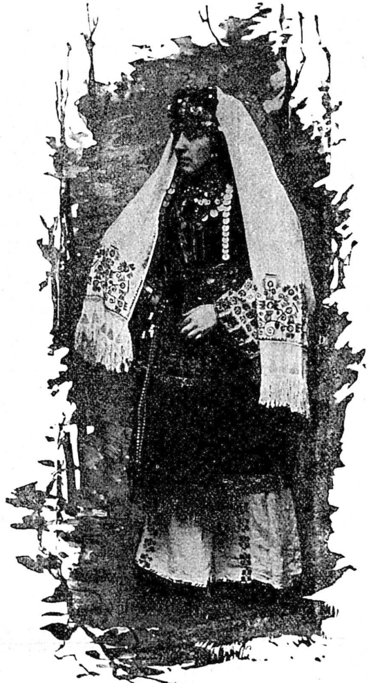
Jeune fille de Sarajewo.

Sarajewo , la capitale de la Bosnie, est une des plus belles villes turques, et elle s'appuie aux flancs d'une fertile montagne.