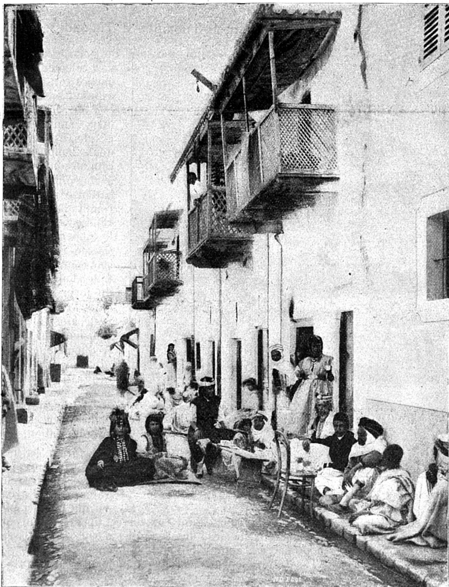
Une rue de Biskra

délicieux. Oran est une ville essentiellement commerciale et industrielle; une des industries les plus florissantes est celle du tabac (bastos). Les environs d'Oran sont extrêmement pittoresques: à citer le Ravin-Vert, Santa-Cruz, le Camp-des-Planteurs, Mers-el-Kébir où l'on aboutit par une belle route en corniche. Au delà de Constantine, une ligne ferrée mène à la jolie ville de Tlemcen, par Sidi-Bel-Abbès.