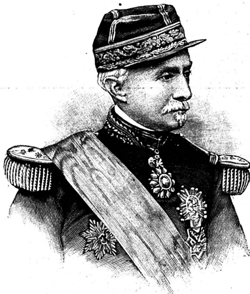
Le général d'Exéa.

Jeune fille cafre jouant le « rumbu ». — Parmi les nombreuses peuplades de l'Afrique méridionale les Cafres se distinguent par leur intelligence, leur courage et leurs bonnes qualités. Un voyageur anglais vante leur esprit d'hospitalité et leur goût pour la musique. Celle-ci toutefois ne pourra pas rivaliser avec notre art musical européen, mais les sons que la jeune fille sait tirer du « rumbu », instrument de musique fort primitif, suffisent pour enchanter les jeunes auditeurs qui écoutent, comme charmés, la jeune joueuse.