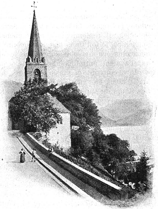
Eglise à Montreux

Eglise à Montreux. — Montreux, que l'on pourrait comparer à Nice par sa position enchanteuse, a un climat tellement doux que le laurier, le figuier, le grenadier y croissent en pleine terre.