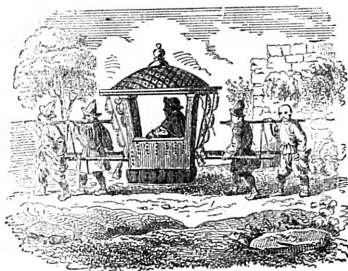
Mandarin faisant une promenade en palanquin.

Hong-Tchang, toujours prépondérant, et par le prince Kong, qui approuvait sa politique, se réserva donc une part dans le gouvernement et rendit son approbation obligatoire pour les affaires les plus importantes. Cependant, petit à petit, son influence déclina devant celle de