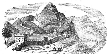
La grande muraille de la Chine près de Pékin.