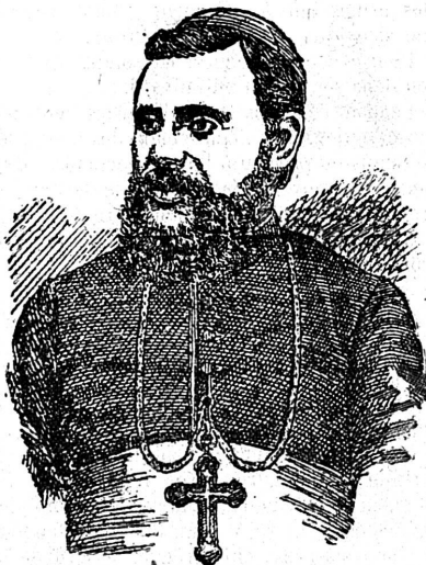
Evêque titulaire d'Euménie, vicaire apostolique de la Mandchourie septentrionale, massacré à Moukden le 13 juillet en compagnie de quatre missionnaires et de deux sœurs hospitalières.