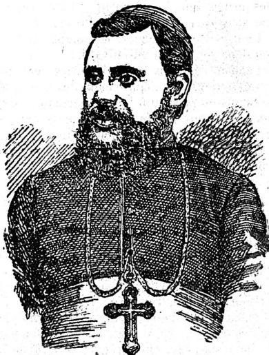
Evêque titulaire d'Emmie, vicaire apostolique de la Mandchourie septentrionale, massacré à Moukden le 13 juillet en compagnie de quatre missionnaires et de deux sœurs hospitalières.