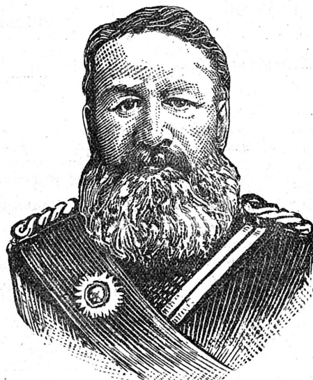
† Le général Piet Joubert ancien généralissime des Boers.