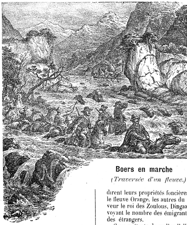
Boers en marche

vers 1820, 4 000 colons anglais étaient débarqués au fond de la baie d'Algoa, à Port Elisabeth, alors petit village composé de huttes, devenu aujourd'hui une cité florissante dont l'importance commerciale dépasse celle du Cap.