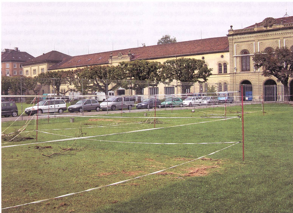
Kasernenareal, September 2002 (J. Stollmann)

changed scripts and another group realised them on the same day. Students were free to realise the script in documentary form, that is, by filming the activities of third parties, or in fictional form, that is, by having the group itself act out the activities. It was important to offer the choice between these two options for the subsequent discussion on what is often a thin line between documentation and fiction. The outcome of this first exercise was a series of very short staged projects on the uses of Josefs-wiese and Stadelhofen Square.