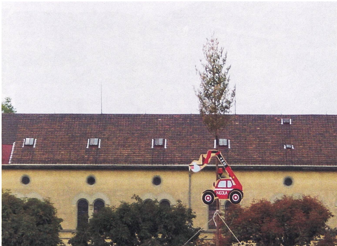
Kasernenareal, September 2002 (J. Stollmann)

dents as a place to live and has generated a lively cultural and pub scene.