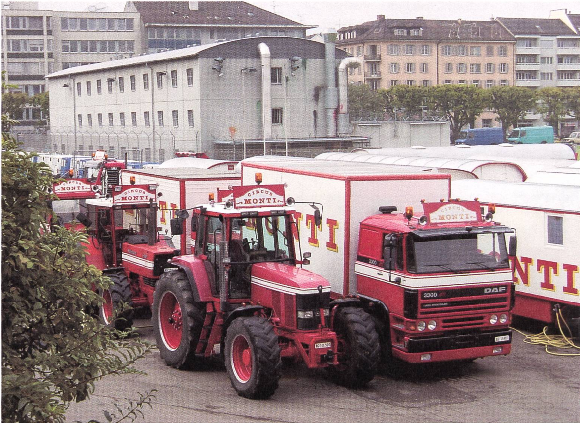
Kasernenareal, September 2002

arbeitete ein Teil der Studierenden narrativ und setzte sich mit den Themen der Überwachung, Prostitution und Kriminalität auseinander. Das Kasernenareal funktionierte als Bühne und als Katalysator für das Erzählen von Handlungen und der Räume die sie kreieren. Andere Arbeiten untersuchten das Gelände auf seine strukturellen Qualitäten hin und versuchten so die vom alltäglichen Blick leicht übersehenen Qualitäten der Anlage aufzudecken. Auch bei diesen strukturellen Arbeiten wurde eine Form des Handelns im Raum exploriert, nämlich die inszenierte Bewegung der Kamera. Diese Videoarbeiten geben einen Hinweis darauf, dass die Bewegung der Kamera den (filmischen) Raum erst erschafft. Die filmische Montage komplettiert diese schöpferische Inszenierung des Raumes.