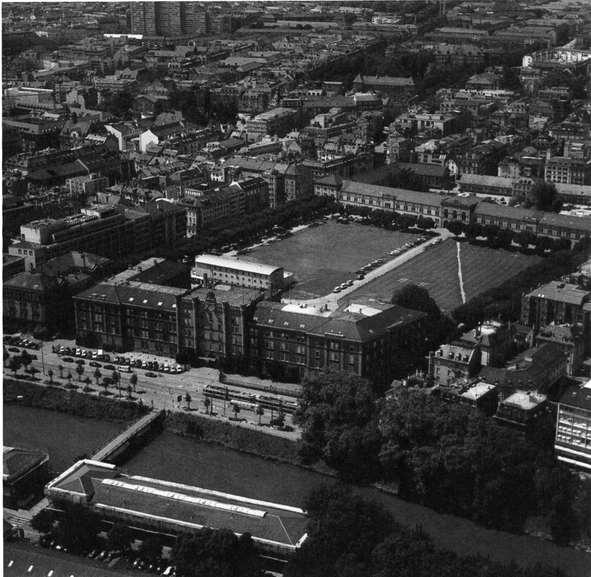
Luftbild, ca. 2002, mit Polizeigefängnis. Aerial picture, ca. 2002, with prison.