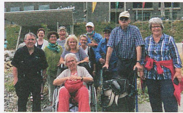
Die Mitglieder der SHG Toggenburg auf der Schwägälp.