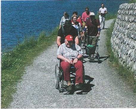
Genussvolle Ausflüge rund um Churwalden.

Am Anreisetag zur pflegebegleiteten Ferienwoche am 20. Juni 2022 waren alle voller Vorfreude. Dabei war auch eine leise Anspannung zu spüren. Die Pflegenden wurden einzelnen Patientinnen und Patienten zugeteilt, und die Chemie harmonierte von Anfang an, sodass wir schnell zu einem eingeschworenen Zweier-Team zusammenwuchsen. Es waren herausfordernde Tage, denn die Befindlichkeit der Patientinnen und Patienten variierte täglich. Doch wir konnten alle Ausflüge ausnahmslos geniessen, ob Fleischrocknerei, Alpkäserei, Puppenmuseum, Kirchenbesichtigung oder Streichelzoo. Höhepunkt des Schlussabends war der Auftritt einer Jodlerin und eines Akkordeonisten.