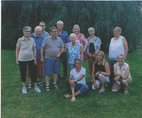
Im Park der Rehaklinik Dussnang.