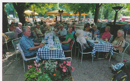
Unter den Bäumen im Dählhölzli.