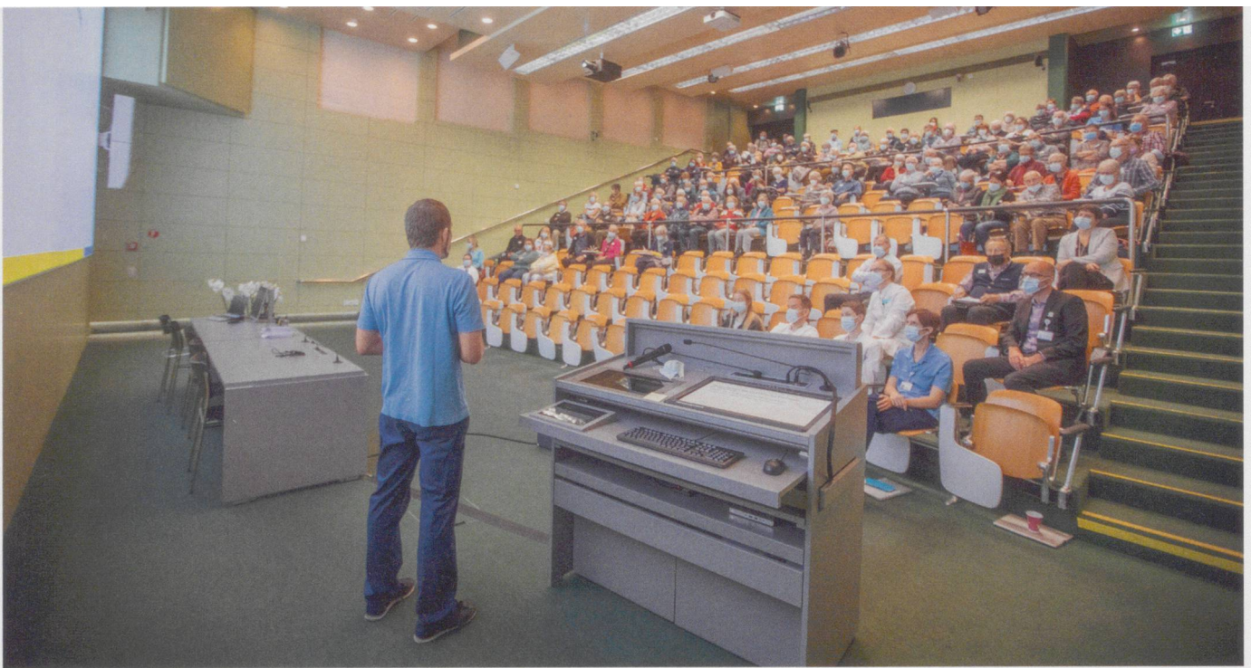
Wegen der Corona-Pandemie war die Teilnehmerzahl am Informationstag beschränkt.