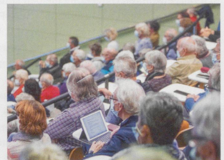
Aufmerksame Zuhörerinnen und Zuhörer.

Um dies gezielt zu trainieren, gibt es verschiedene logopädische Therapiemöglichkeiten. Generell gilt: Betroffene sollten so früh wie möglich mit Logopädie beginnen (vgl. Hunziker, Magazin Parkinson 121). Gut erforscht ist die Wirksam-