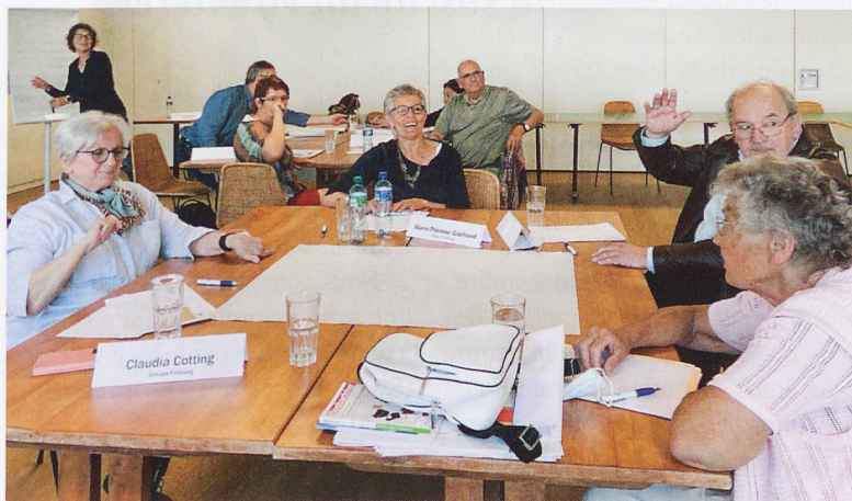
Dans le cadre d'ateliers, les responsables discutent de ce qui est important pour le groupe.