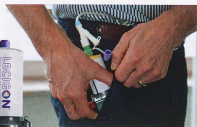
Pompa per la triplice combinazione. Foto: pgc Stadapharm GmbH

Fonte: comunicato stampa di stada.de del 2 febbraio 2021.