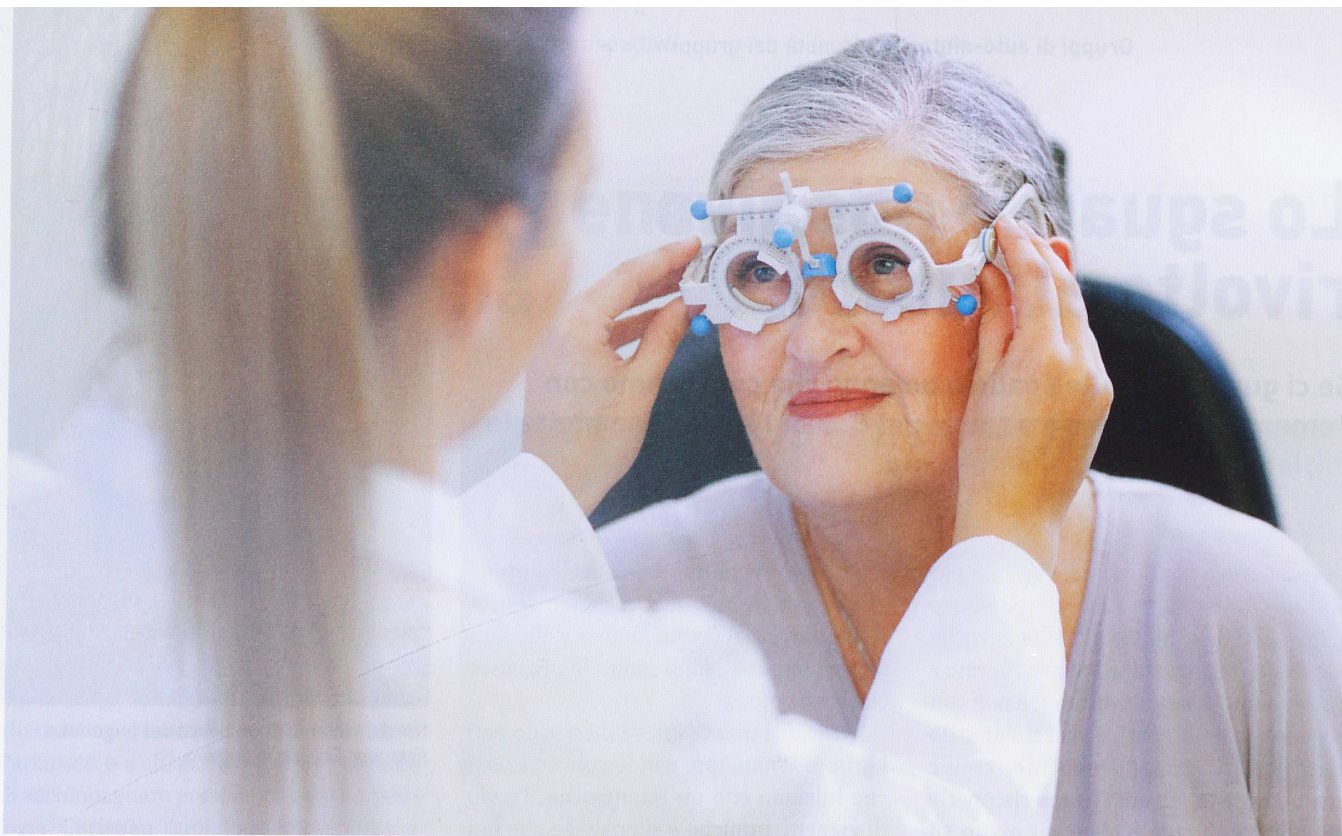
Una parkinsoniana: «A volte vedo doppio.»