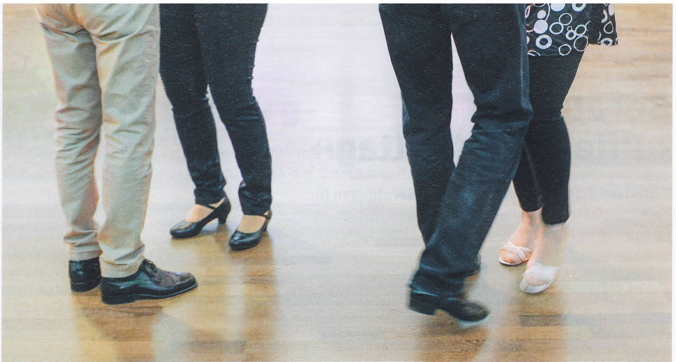
Stolperfallen lauern überall. Ideal ist es, Teppiche wegzuräumen und aktiv zu bleiben. Auch Tangotänzen kann präventiv wirken.