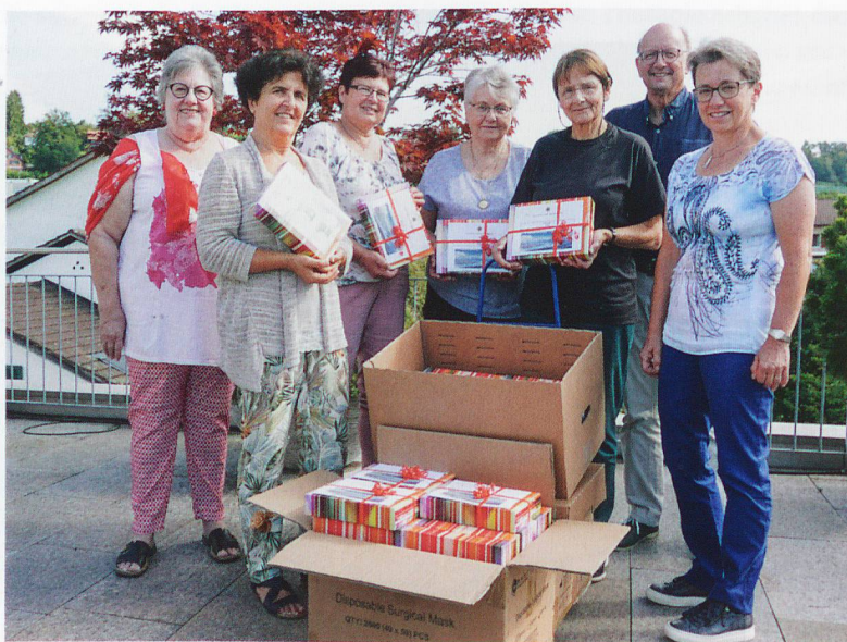
Die SHG-Leiterinnen nahmen im September die Geschenke entgegen.