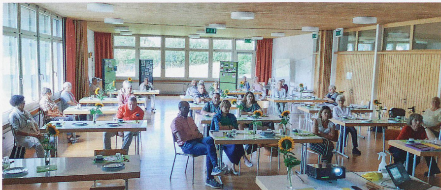
Mitglieder und Gäste an der 30-Jahr-Feier.

Die Selbsthilfegruppe Toggenburg – ehemals Wattwil – hat sich umbenannt. Und dies 30 Jahre nach der Gründung.