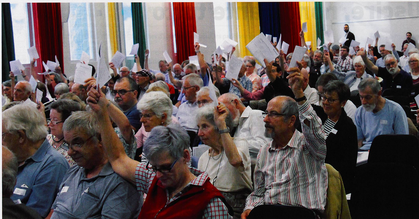
Assemblea generale 2019. Nel 2020 questa vicinanza non è stata possibile: le votazioni hanno dovuto svolgersi per corrispondenza.