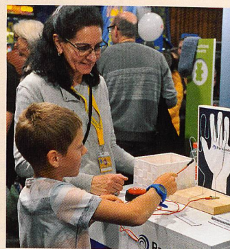
Jeu d'adresse au salon Planète Santé 2019.

Cette année, grâce à la présence active et soutenue des responsables des groupes d'entraide du Valais, les personnes intéressées ont pu rencontrer des parkinsonien(ne)s et des membres de leur entourage, discuter avec elles / eux et leur poser des questions directement. André Dembinski