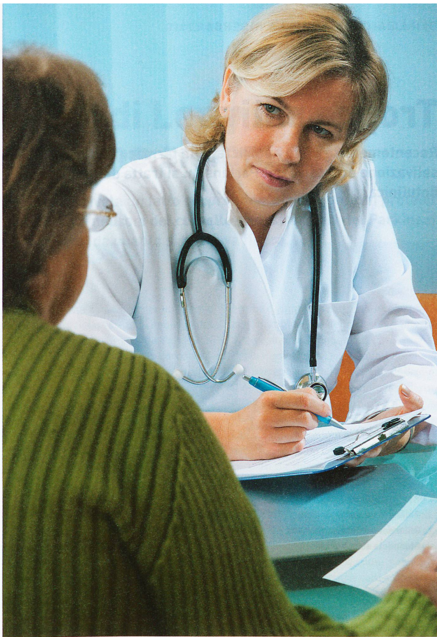
La fiducia nei confronti del medico curante è indispensabile per far sì che il paziente parli anche di temi difficili.

Quando si è confrontati a una patologia multiforme come il Parkinson, con sintomi che a volte cambiano di ora in ora, assumono somma importanza proprio le osservazioni che sfuggono all'occhio del medico nel breve tempo di una visita. Il feedback del fisioterapista, della logopedista, dello Spitex e dei familiari completa un quadro che, se si limitasse alle impressioni momentanee raccolte durante la consultazione, rimarrebbe parziale e inaffidabile. Nel caso dei parkinsoniani residenti in istituto, le annotazioni sul decorso fatte dal personale curante rappresentano importanti complementi dell'anamnesi e devono essere lette dal neurologo. Visto