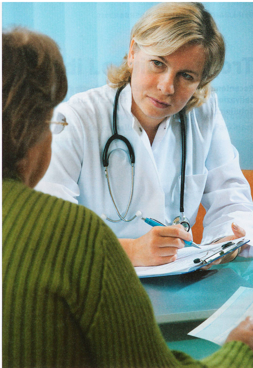
La fiducia nei confronti del medico curante è indispensabile per far sì che il paziente parli anche di temi difficili.

Quando si è confrontati a una patologia multiforme come il Parkinson, con sintomi che a volte cambiano di ora in ora, assumono somma importanza proprio le osservazioni che sfuggono all'occhio del medico nel breve tempo di una visita. Il feedback del fisioterapista, della logopedista, dello Spitem e dei familiari completa un quadro che, se si limitasse alle impressioni momentanee raccolte durante la consultazione, rimarrebbe parziale e inaffidabile. Nel caso dei parkinsoniani residenti in istituto, le annotazioni sul decorso fatte dal personale curante rappresentano importanti complementi dell'anamnesi e devono essere lette dal neurologo. Visto