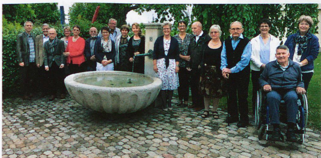
Oben: Turnen in Tschugg. Unten: Gruppenfoto.