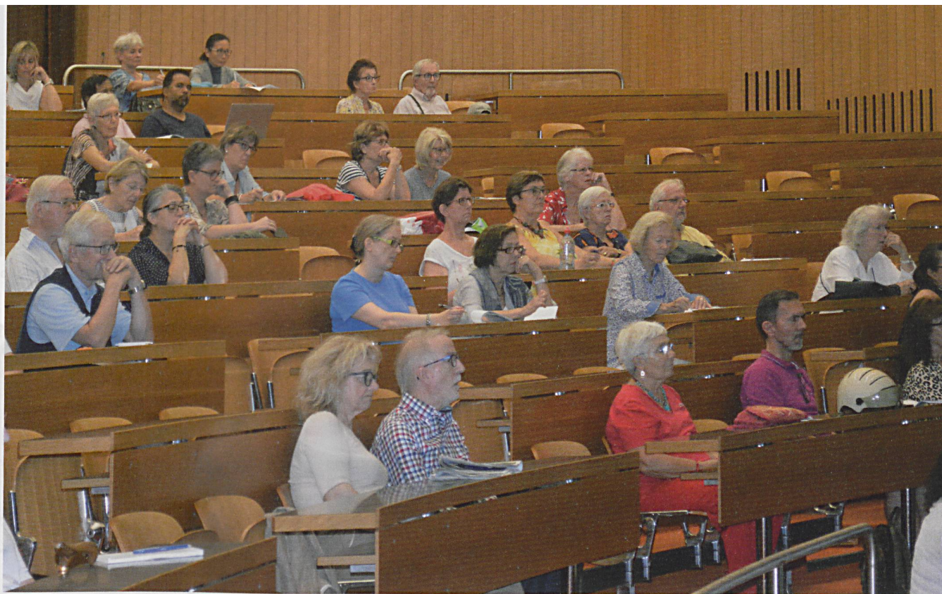
Une centaine d'auditrices et d'auditeurs s'est rassemblée à Genève.