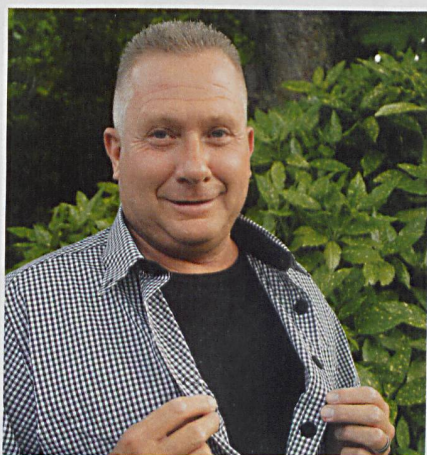
Les boutons de ces chemises sont des trompe-l'œil. Une bande velcro assure la fermeture.