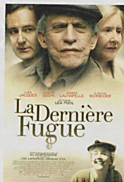
« La Dernière Fugue » (2011)

Depuis plusieurs décennies, trois hommes et une femme jouent ensemble dans un quatuor à cordes et effectuent des tournées à succès dans le monde entier. À l'aube de la nouvelle saison, Peter (Christopher Walken), violoncelliste et fondateur du groupe, annonce à ses collègues qu'il souffre du Parkinson. Il souhaite donner un dernier grand concert, si la maladie le permet. C'est alors qu'éclatent des conflits latents. Robert (Philip Seymour Hoffman) ne veut plus jouer le second violon. Le premier film du réalisateur Yaron Zilberman explore la complexité de la sensibilité humaine.