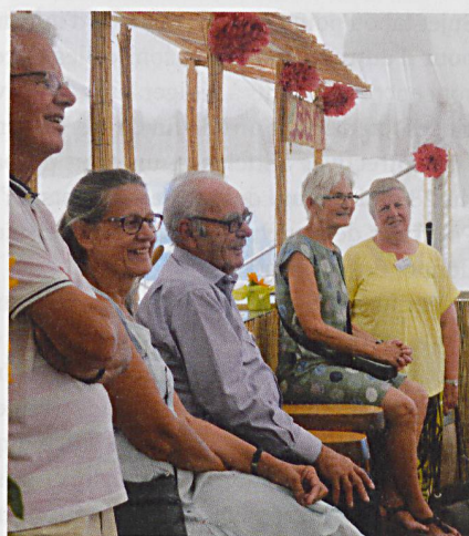
La journée fut ponctuée d'animations sympathiques.