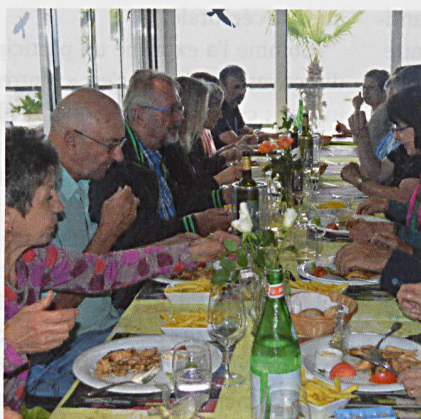
Le groupe s'est donné rendez-vous à la Pêcherie.