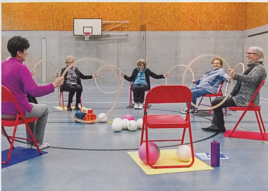
Fare ginnastica insieme fa piacere e mantiene il fisico.