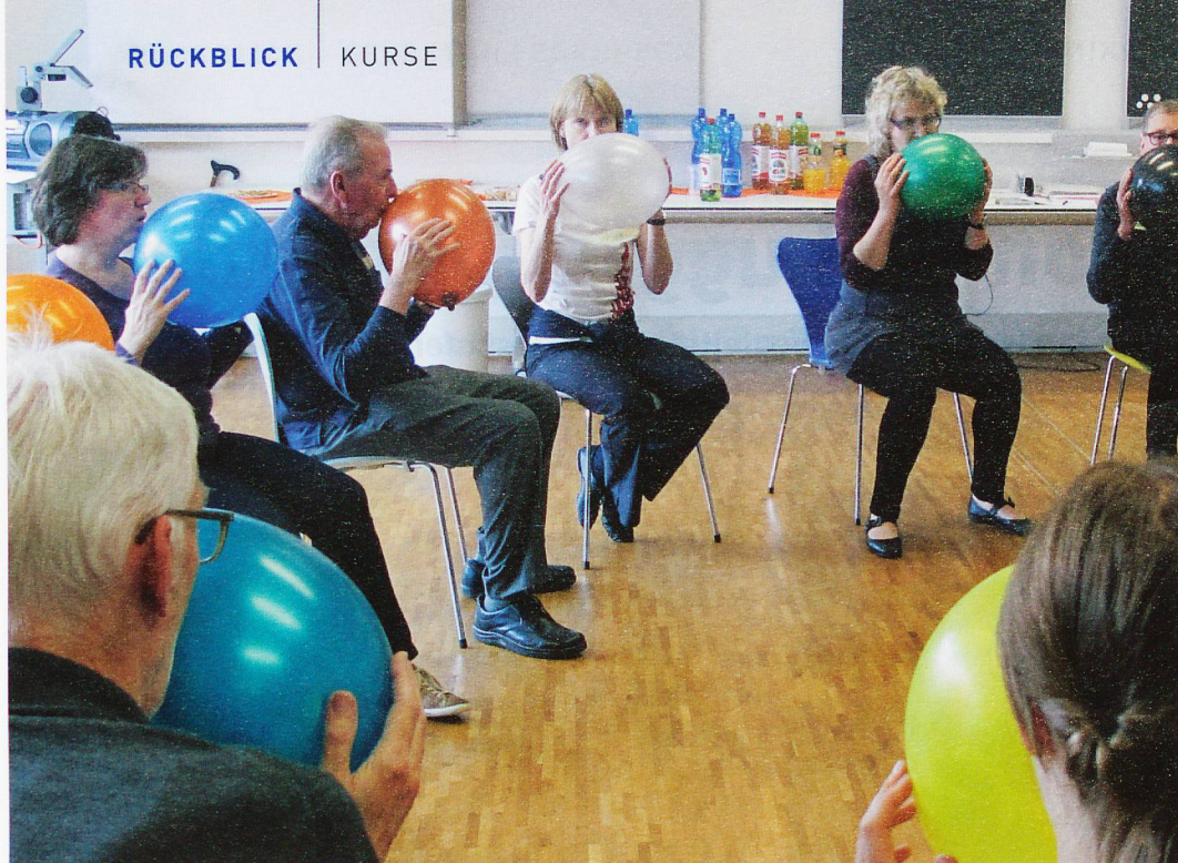
Gemeinsam üben macht mehr Spass: Stimmtraining mit Luftballons.