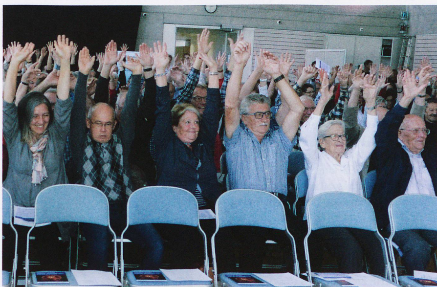
Rester en mouvement, et de préférence ensemble : les participants à la séance d'information de Zihlschlacht en 2016.