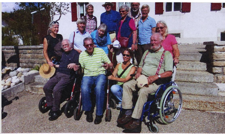
Die Parkinsonferiengruppe auf dem Ausflug Vue-des-Alpes...