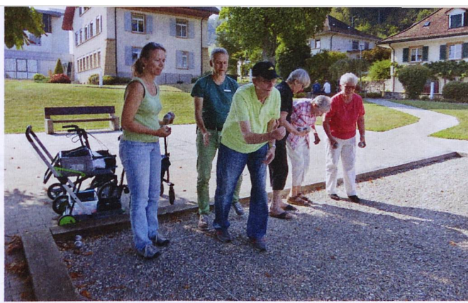
... und beim Pétanque-Spiel vor der Klinik Bethesda in Tschugg.