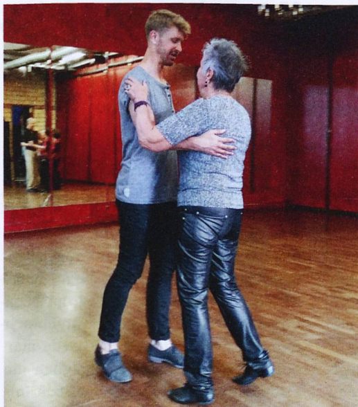
Mutter und Sohn tanzen einen Tango.