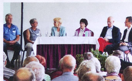
La mobilité était sur toutes les lèvres.