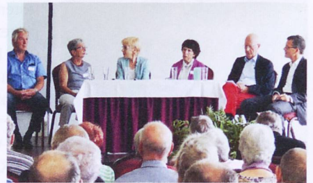
Mobilität war Thema auf dem Podium.