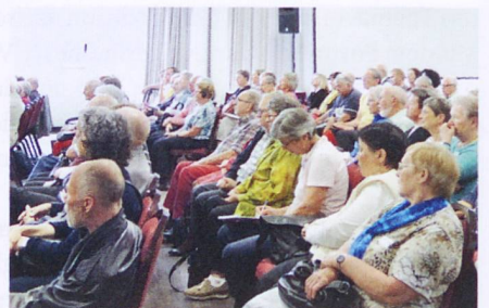
Das Publikum beteiligte sich mit Fragen.