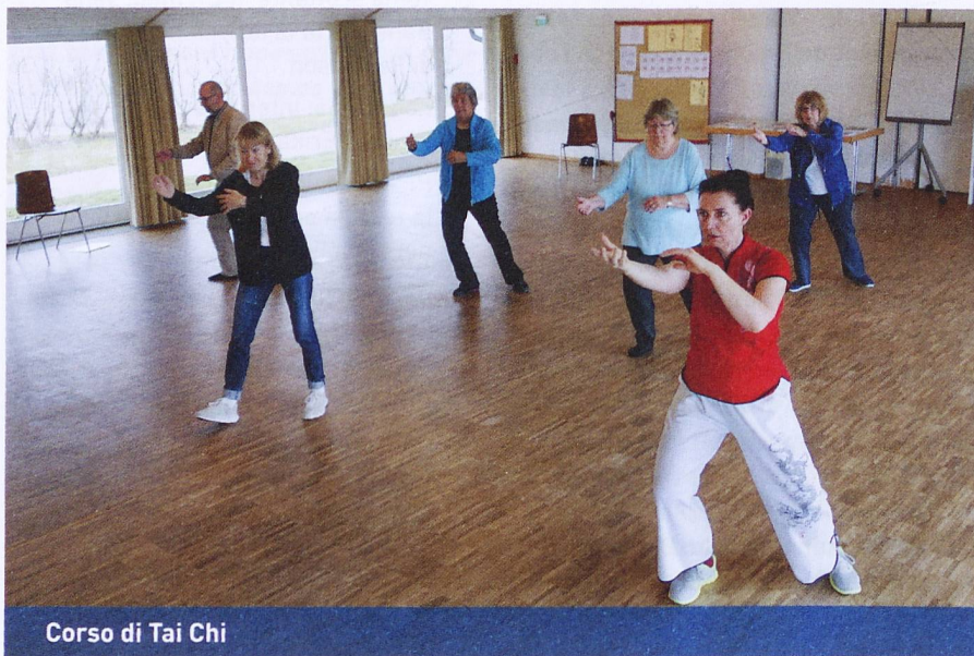
Corso di Tai Chi