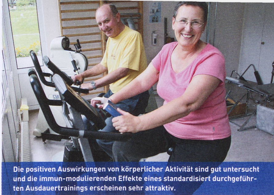
Die positiven Auswirkungen von körperlicher Aktivität sind gut untersucht und die immun-modulierenden Effekte eines standardisiert durchgeführten Ausdauertrainings erscheinen sehr attraktiv.

gewählten Trainingsmodalität und der gewählten Trainingsintensität zeigt die Wichtigkeit des Trainingsplans auf, da durch die höheren Trainingsintensitäten schneller positive Ergebnisse erreicht werden können. Diese spezifischen Wirkweisen sind in der Abbildung (Seite 11) dargestellt.