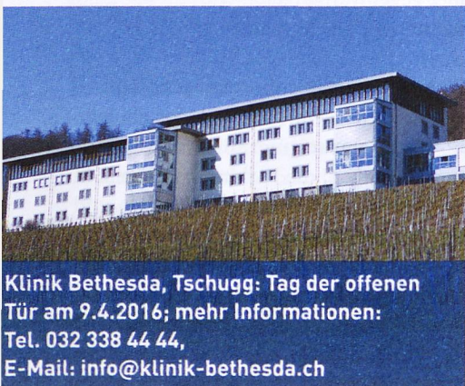
Klinik Bethesda, Tschugg: Tag der offenen Tür am 9.4.2016; mehr Informationen: Tel. 032 338 44 44, E-Mail: info@klinik-bethesda.ch