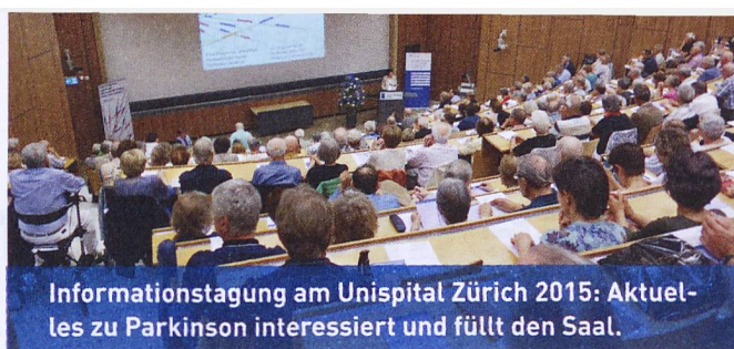
Informationstag am Unispital Zürich 2015: Aktuelles zu Parkinson interessiert und füllt den Saal.