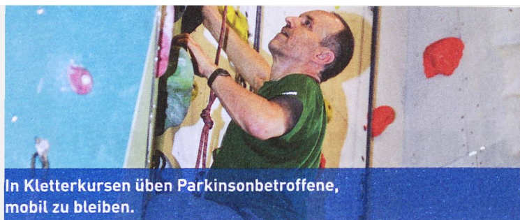
In Kletterkursen üben Parkinsonbetroffene, mobil zu bleiben.