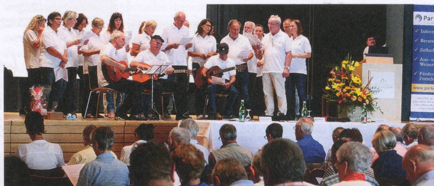
La gioiosa sorpresa musicale dei coristi del gruppo di auto-aiuto di giovani parkinsoniani «JUPP Sântis» con la corale di Lustenau.

È emerso che siamo sulla buona strada, ma nei tre ambiti della mobilità, della sicurezza finanziaria e dell'azione in campo politico a favore delle persone colpite è stato evidenziato un potenziale di miglioramento.