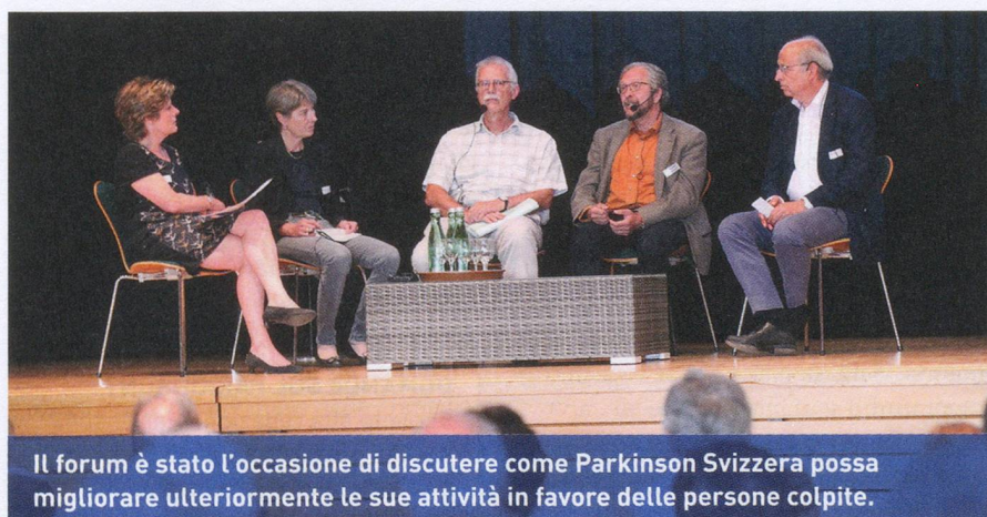
Il forum è stato l'occasione di discutere come Parkinson Svizzera possa migliorare ulteriormente le sue attività in favore delle persone colpite.

Come da tradizione, anche nel 2016 l'Assemblea generale si terrà in una nuova località: la 31ª AG dell'associazione si svolgerà sabato 11 giugno 2016 a Friburgo. jro