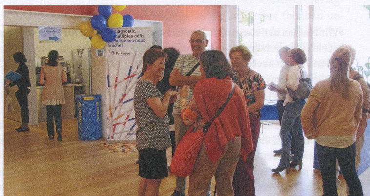
In Lausanne trat die Vereinigung am 22. Mai bei den Portes ouvertes in der Site de Plein Soleil an die Öffentlichkeit.