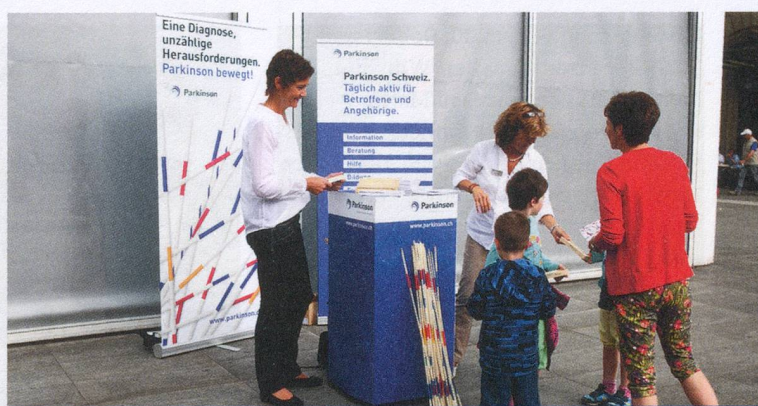
Am Tag der Mitgliederversammlung (13. Juni 2015) war die Vereinigung mit einem Informationsstand in Winterthur aktiv.