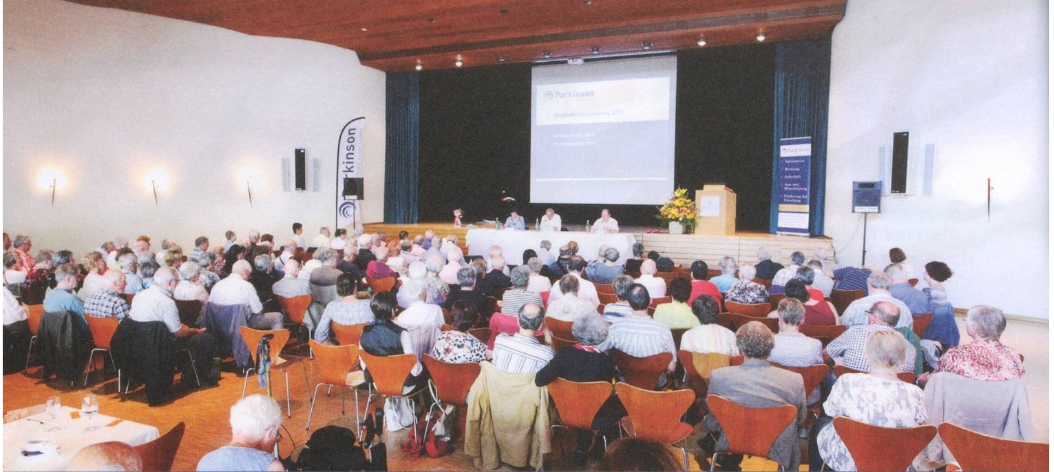
Der Hitze getrotzt: 112 stimmberechtigte Mitglieder und 57 Gäste reisten zur Mitgliederversammlung nach Winterthur.