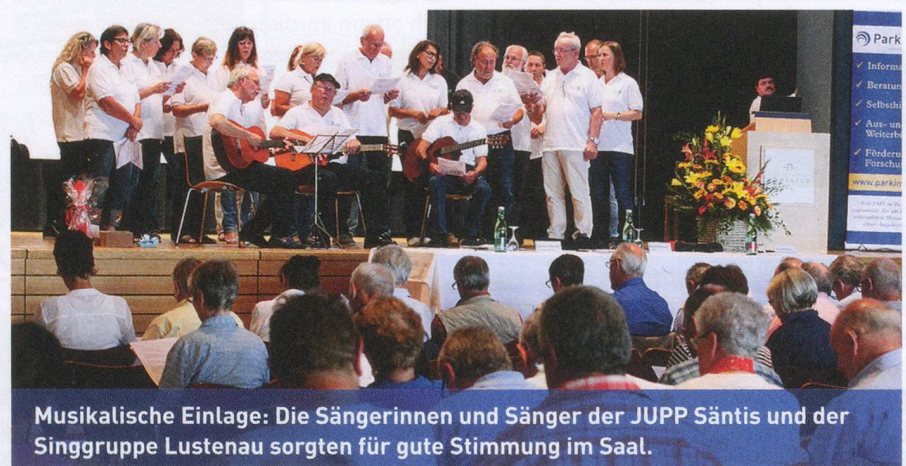
Musikalische Einlage: Die Sängerinnen und Sänger der JUPP Sántis und der Singgruppe Lustenau sorgten für gute Stimmung im Saal.