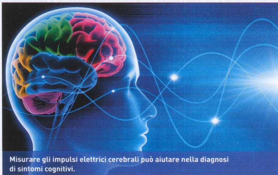
Misurare gli impulsi elettrici cerebrali può aiutare nella diagnosi di sintomi cognitivi.

Sulla base di questi due studi, i ricercatori basilesi sono giunti alla conclusione che la misurazione mediante QEEG è un metodo adeguato e non invasivo per la diagnosi e per una migliore comprensione dei disturbi cognitivi dovuti al Parkinson. Un vantaggio delle misurazioni con QEEG, è che non comportano un effetto di apprendimento – con relativo rischio di produrre risultati falsati – come gli usuali test neuropsicologici, i quali vengono ripetuti più volte. Tuttavia, prima che questo metodo possa essere impiegato nella pratica clinica sono necessari altri studi. jro