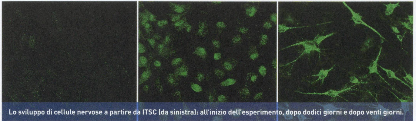
Lo sviluppo di cellule nervose a partire da ITSC (da sinistra): all'inizio dell'esperimento, dopo dodici giorni e dopo venti giorni.