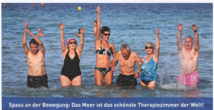
Spass an der Bewegung: Das Meer ist das schönste Therapiezimmer der Welt!

Diese wird, wie beim ersten Mal, wieder von der Mawi Reisen AG in Frauenfeld durchgeführt. Das Ferienangebot richtet sich an alle, die unter südlicher Sonne, am Strand und im glasklaren Meer, beim Nordic Walking, bei Gymnastik und in ausgedehnten Ruhepausen aktiv neue Energie tanken möchten. Neben dem fachkundig geleiteten und individuell auf die Teilnehmer abgestimmten Bewegungsprogramm wird es natürlich auch dieses Jahr wieder spannende Ausflüge geben. Und selbstverständlich werden die Gäste auch 2015 wieder kulinarische Höhenflüge erleben.