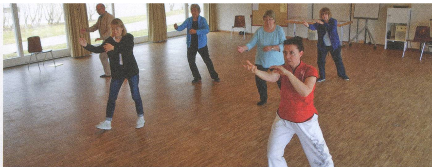
Tai-Chi für Betroffene: Für den Kurs im Oktober hat es noch wenige Plätze.