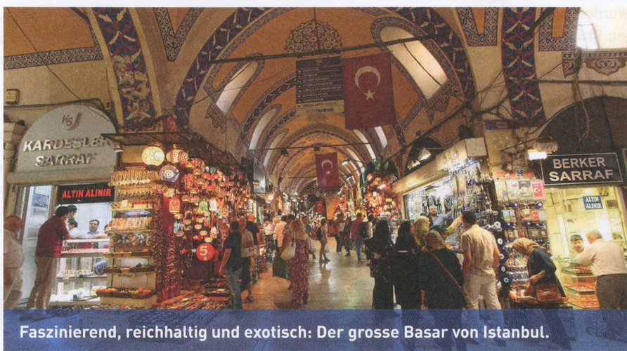
Faszinierend, reichhaltig und exotisch: Der grosse Basar von Istanbul.