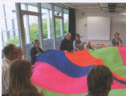
Im Seminar «Bewegung und Stimme» wird gemeinsam unter Zuhilfenahme von Hilfsmitteln wie einem Fallschirm, Bällen und dem eigenen Daumen geübt.