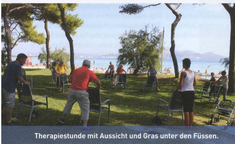
Therapiestunde mit Aussicht und Gras unter den Füßen.