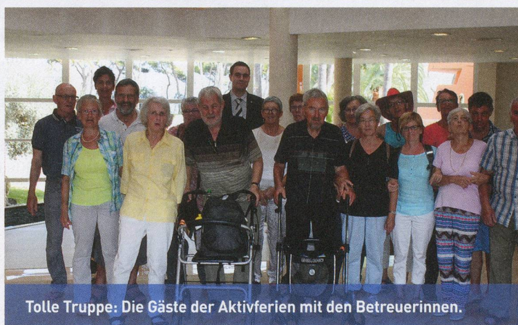
Tolle Truppe: Die Gäste der Aktivferien mit den Betreuerinnen.