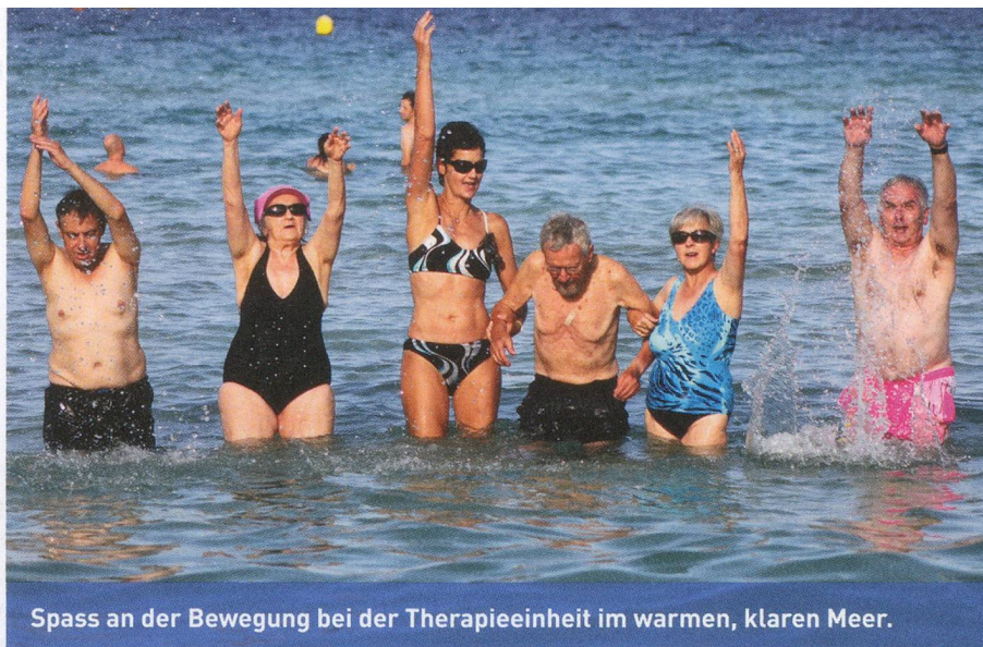
Spass an der Bewegung bei der Therapieeinheit im warmen, klaren Meer.